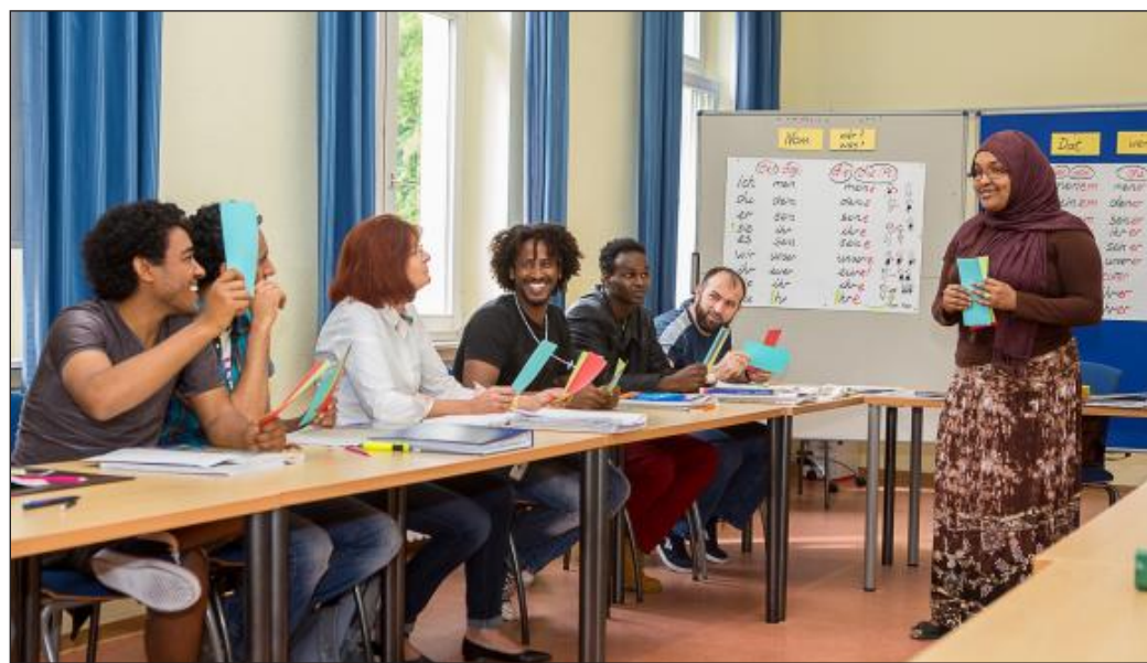
An der VHS des Landkreises wird zwischen fünf Sprachniveaus unterschieden.

Das offene Kursangebot zum Erlernen oder Vertiefen der deutschen Sprache gibt es bereits seit